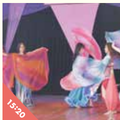
Aujas belly dancers