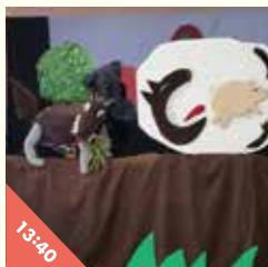
人形劇サークル わわわ