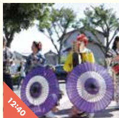
チンドン屋 海泉社