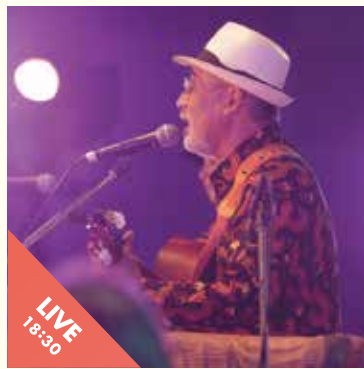
Playa Bonita Social Club