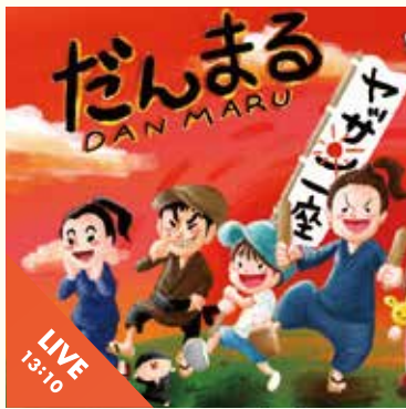
ヤーさん一座の紙芝居 だんまる

雨天時はパフォーマンスはシアターサウス。マーケットはロビー、スタジオで開催します。