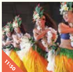
Hui Hula O Leialoha